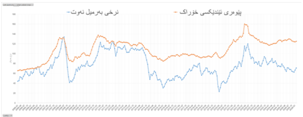
گرافىك 2: نرخى سەبەتەى خۇراك لەھەمبەر نرخى بەرمىل نەوت لە كانوونى دووھى 2005 وە بۇ شوبات 2026